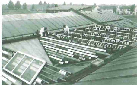
Wat doet kleur onder invloed van de zon? Proefpanelen op het dak van de fabriek van toen moeten dat uitwijzen.