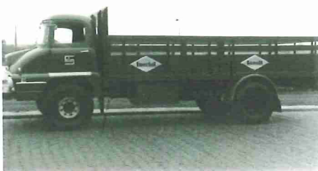
Auto uit het bedrijfspark van het bedrijf uit Velsen.