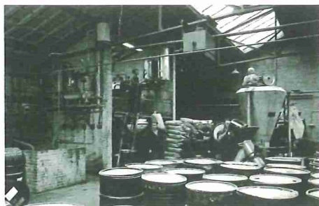
De bitumenfabriek van toen.

Tekst: Anton Stig